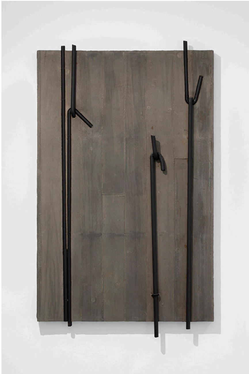
Giuseppe Uncini Muri di cemento n. 151 , 2003 cemento concrete 160 x 96 cm (62,99 x 37,80 in)