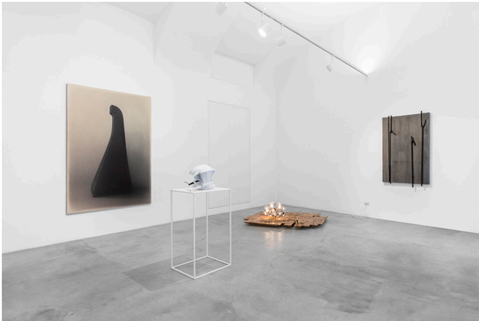
Sospensioni: la materia che parla , MAAB Gallery, Milano, 2025