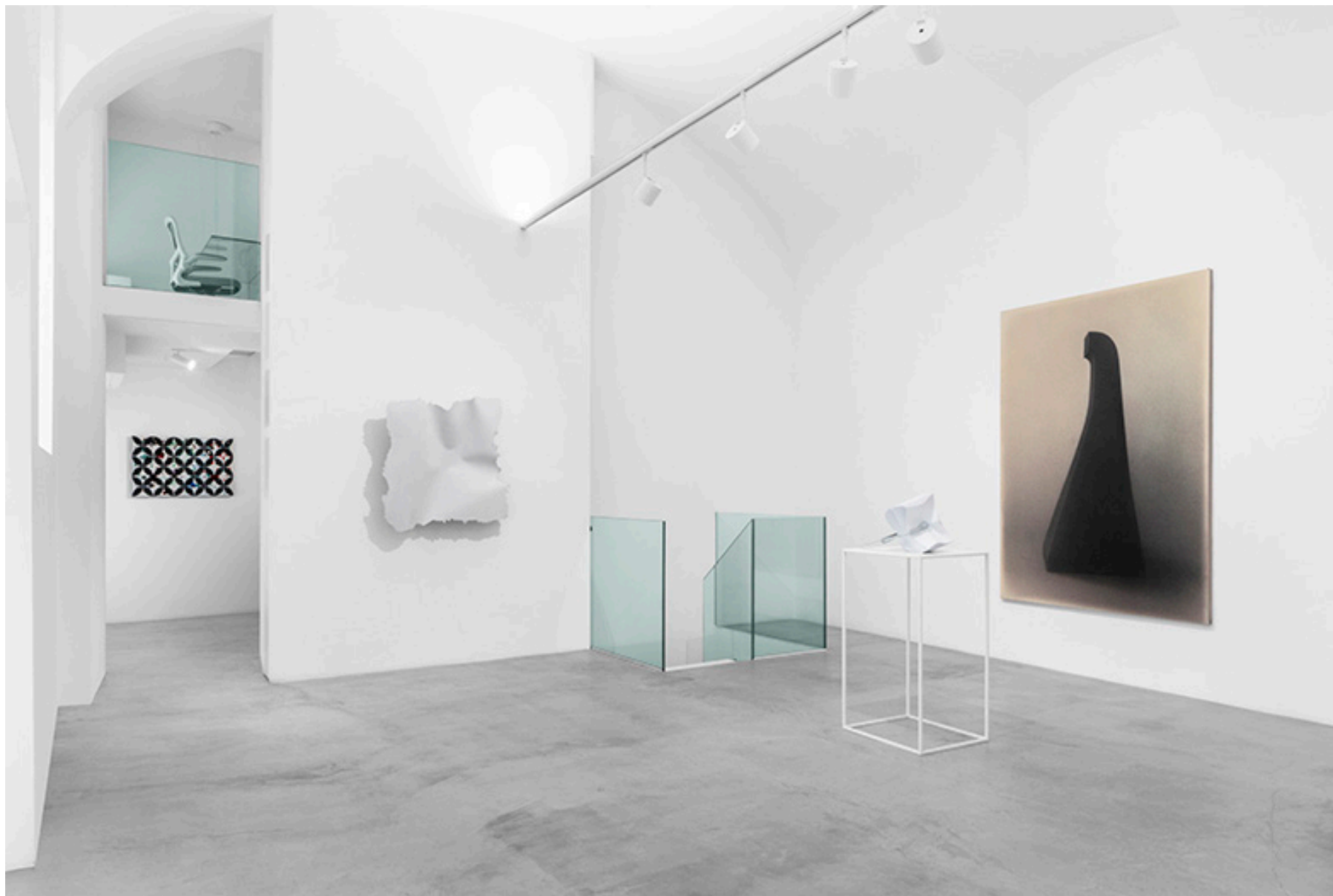
Sospensioni: la materia che parla, MAAB Gallery, Milano, 2025