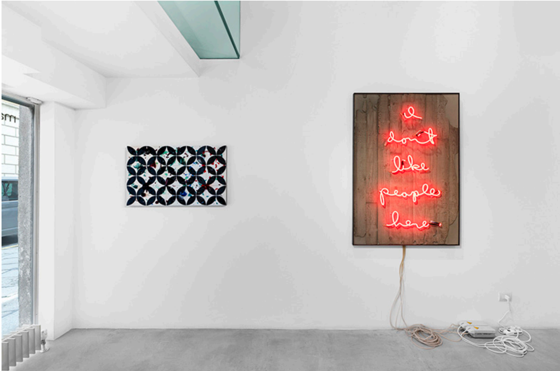
Sospensioni: la materia che parla , MAAB Gallery, Milano, 2025