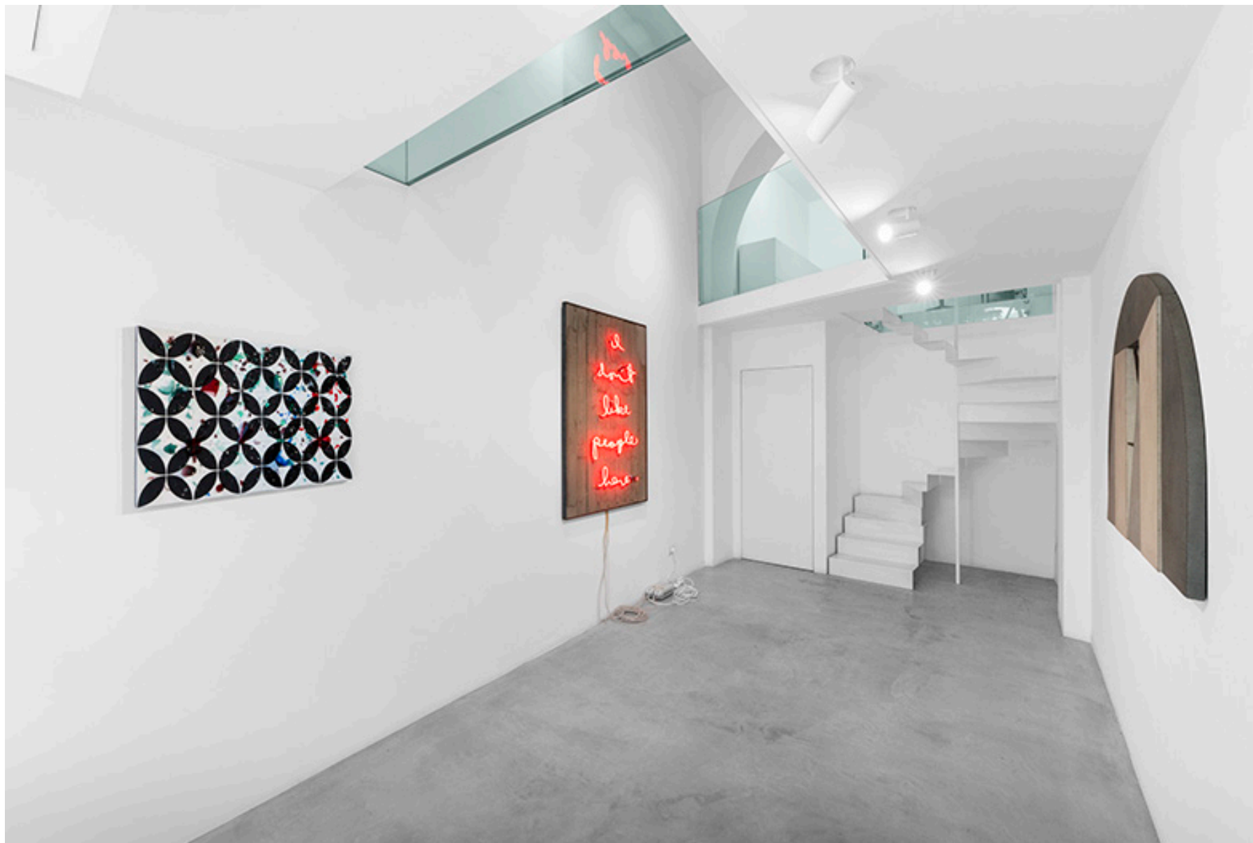
Sospensioni: la materia che parla , MAAB Gallery, Milano, 2025